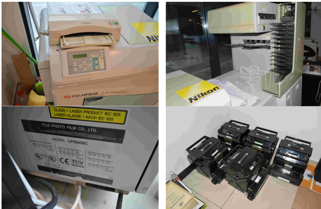
Slika 10.: Fuji film - Frontier 350 LP1500 SC – City centar east