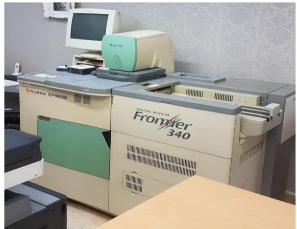
Slika 15.: Fuji film - Frontier 340 SLP1000 SE