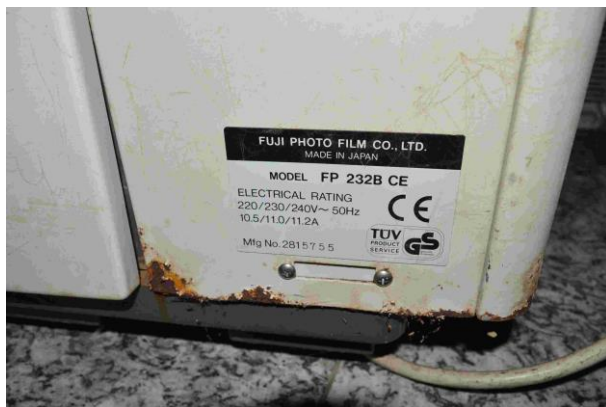
Slika 6.: Fuji photo film – FP 232B CE