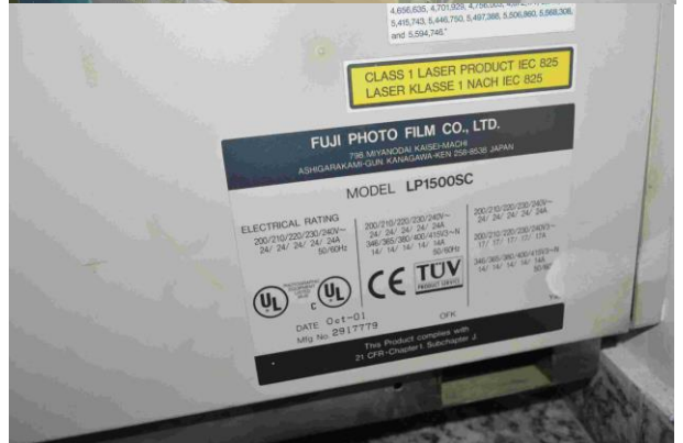
Slika 4.: Fuji film - Frontier 350 LP1500 SC