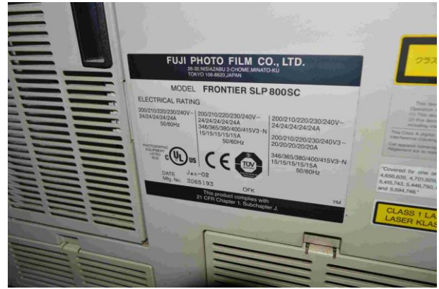
Slika 7.: Fuji photo film - Frontier SLP800 SC