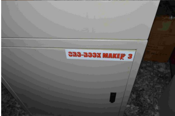
Slika 9.: Foto Book maker 3