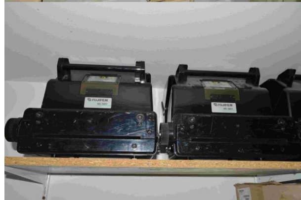
Slika 3.: Fuji film - Frontier 350 LP1500 SC