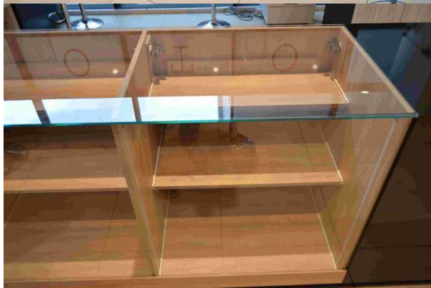
Slika 12.: Prodajni pultevi – City one east