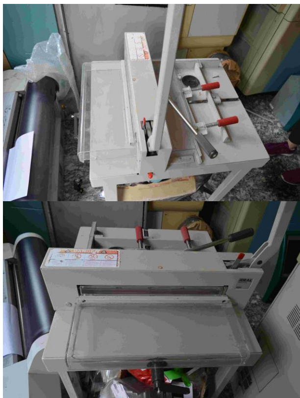
Slika 1.: Nož Ideal