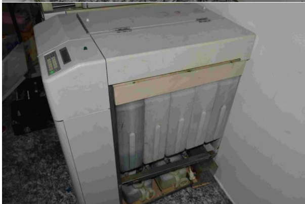
Slika 5.: Fuji photo film – FP 232B CE