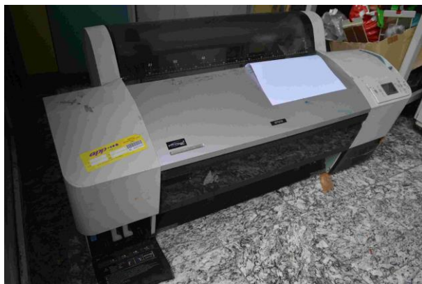
Slika 2.: Ploter Epson Stylus PRO 7800