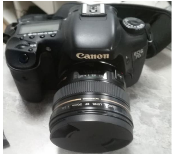
Slika 14.: Fotoaparati Fuji S5 PRO i Canon EOS 70