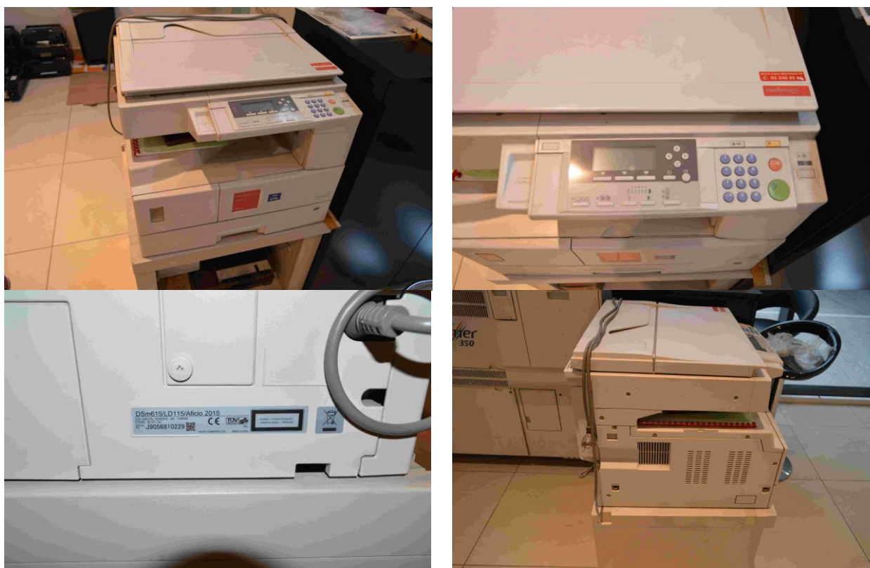
Slika 11.: Pisač/kopirka/Fax – City centar east