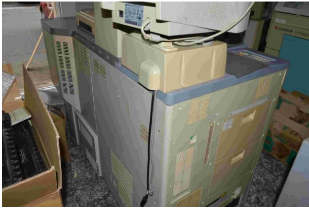
Slika 8.: Fuji photo film - Frontier SLP1000 SE