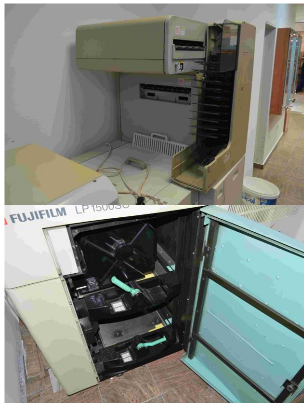
Slika 13.: Fuji film - Frontier 350 LP1500 SC – Importane centar